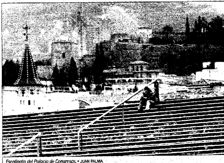
Escalinata del Palacio de Congresos.

Los encuentros de medicina general e interna reunirán a más de 8.000 participantes de todo el mundo que dejarán 24 millones de euros en la ciudad