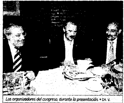
Los organizadores del congreso, durante la presentación.

El responsable del programa de células madre, Bernat Soria, inaugurará el programa, al tiempo que participará en el Congreso Mundial de Medicina Interna. Por su parte, el juez de la Audiencia Nacional Baltasar Garzón clausurará el encuentro el día 16 de octubre. Entre ambas ponencias, profesionales de toda España conocerán las últimas novedades sobre riesgos cardiovasculares, el debate sobre la eutanasia, trastornos mentales, la adicción a las nuevas tecnolo-