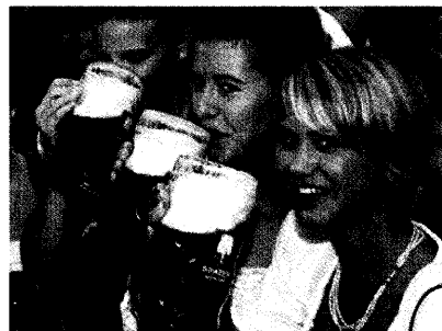
El consumo de alcohol daña más a las mujeres que a los hombres, según varios expertos.

Las mujeres son más susceptibles que los hombres al daño orgánico que produce el alcohol, según varios expertos en Medicina Interna.