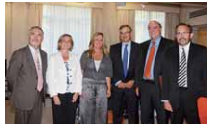
Debe ser tratado por la Conferencia de Presidentes, dado que se trata de un asunto de financiación sanitaria.