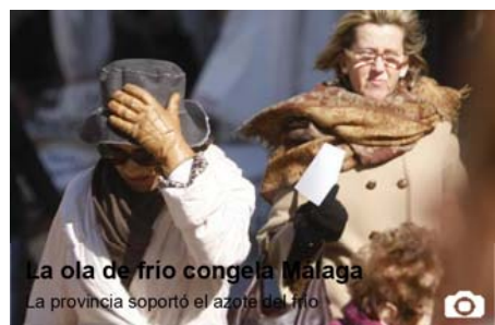
Fotos de la ola de frío en toda Europa La información del tiempo, en Cazatormentas.net