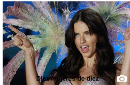
El top 10 de las mujeres más sexys del FHM 2011