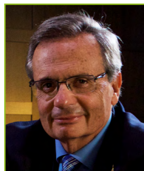
Dr. Rafael Matesanz Acedos

Fundador de la Organización Nacional de Trasplantes