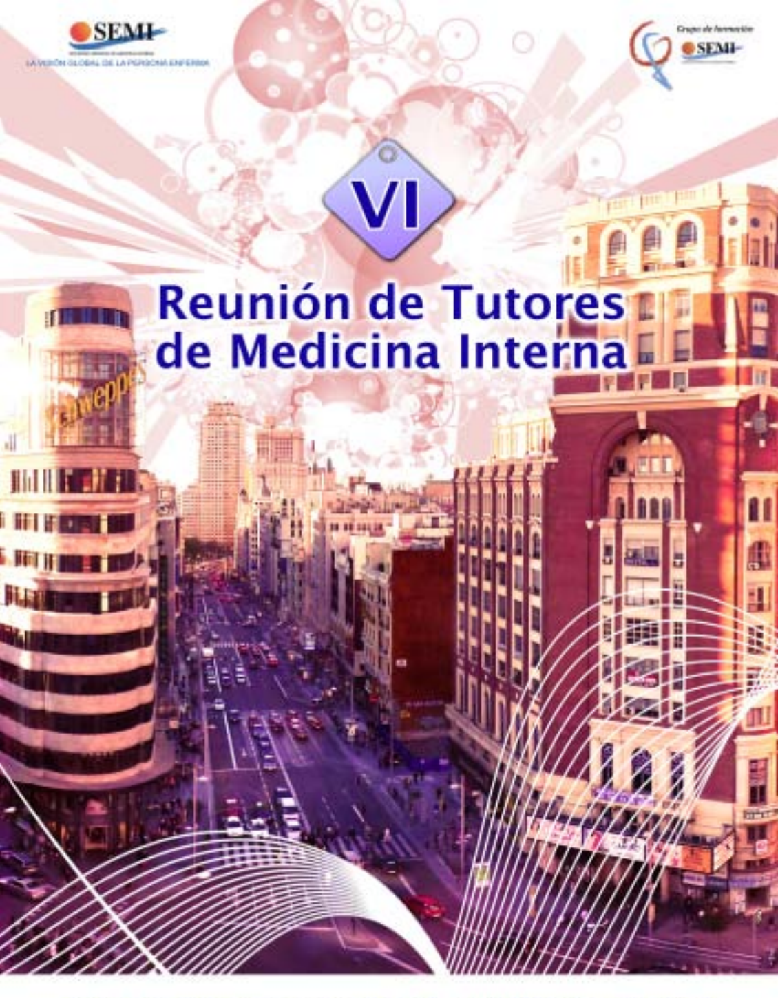
Ministerio de Sanidad y Política Social Madrid - 15 de Octubre 2010